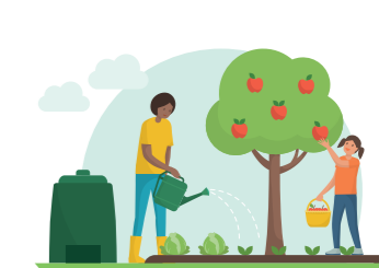
GROW YOUR OWN VEGETABLES