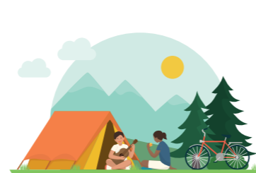
HAVE AN ENVIRONMENTALLY FRIENDLY VACATION