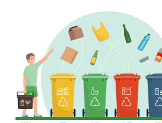
SORT YOUR WASTE CORRECTLY