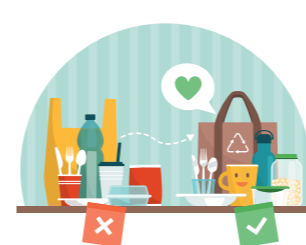
REDUCE PLASTIC ITEMS