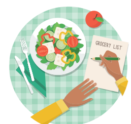
CHOOSE VEGAN AND PLAN MEALS TO AVOID WASTE