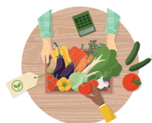
BUY ORGANIC LOCAL FOOD